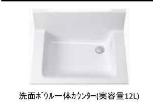
洗面ボウル一体カウンター(実容量12L)