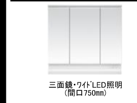
三面鏡・ワイドLED照明(間口750mm)

●商品は印刷のため実際の色とは多少異なっております。●商品によっては、改良などにより仕様、寸法、カラーなどに変更が生じる場合がございます。●本紙明細の写真はイメージとなります。ご発注の際は改めて、お見積り・カタログにて確認の程お願いいたします。