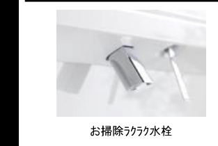
お掃除ラクラク水栓